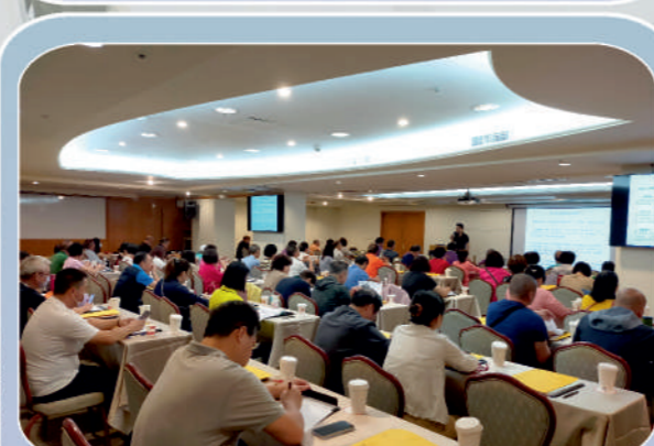
市代表教育訓練_職業場次