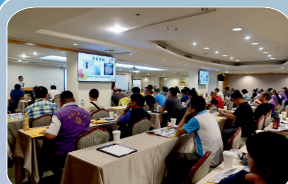
市代表教育訓練_企業場次