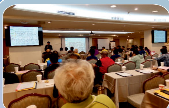
市代表教育訓練_企業場次