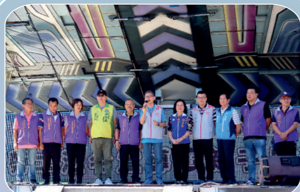
勞工法令宣導暨親子日活動