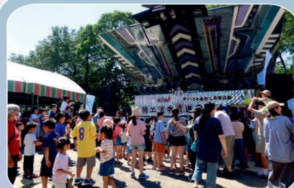
勞工法令宣導暨親子日活動