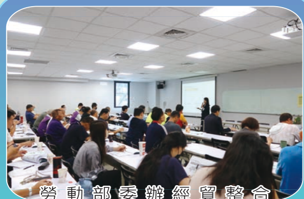
勞動部委辦經貿整合及自由化與勞動政策說明會