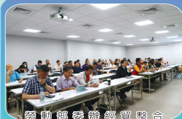
勞動部委辦經貿整合及自由化與勞動政策說明會