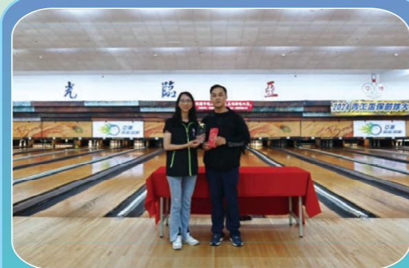
勞工盃保齡球比賽