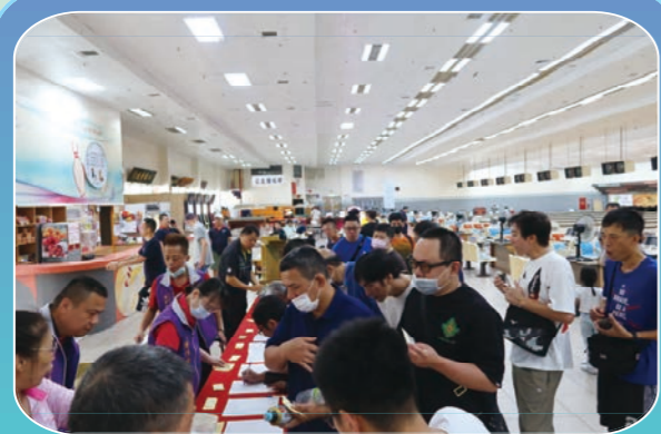
勞工盃保齡球比賽