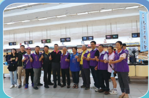
勞工盃保齡球比賽