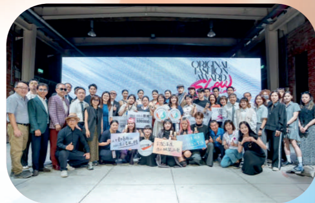
勞動部2025原創服裝大賞頒獎典禮