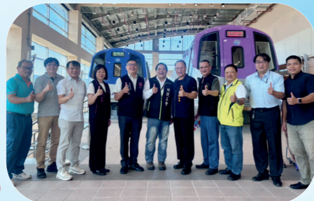
本會理事長受邀出席桃捷桃園大眾捷運工會與公司簽訂團體協約儀式