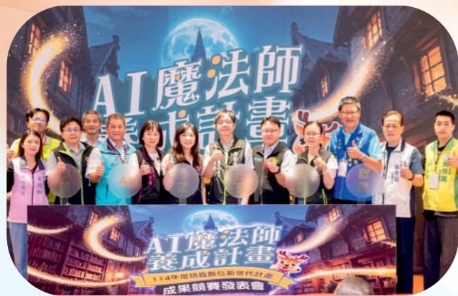
114年度培養數位新世代成果競賽發表會