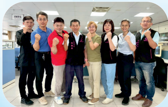
世界先進企業工會&桃園市背部夾脊按摩服務人員職業工會加入本會