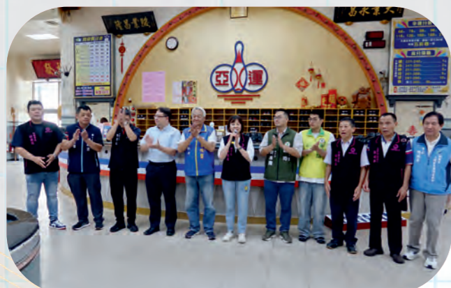
勞工盃保齡球比賽