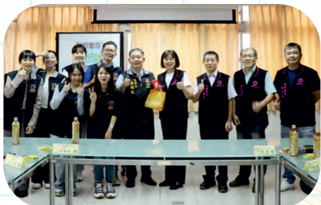
中華民國全國總工會來訪