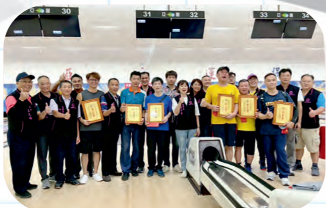
勞工盃保齡球比賽