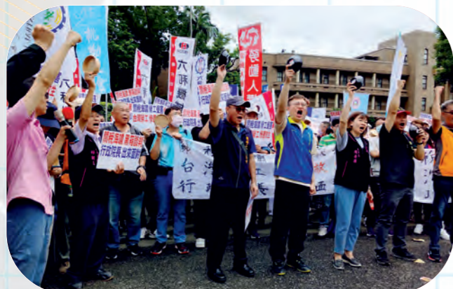
聲援勞關盟行政院戶外記者會