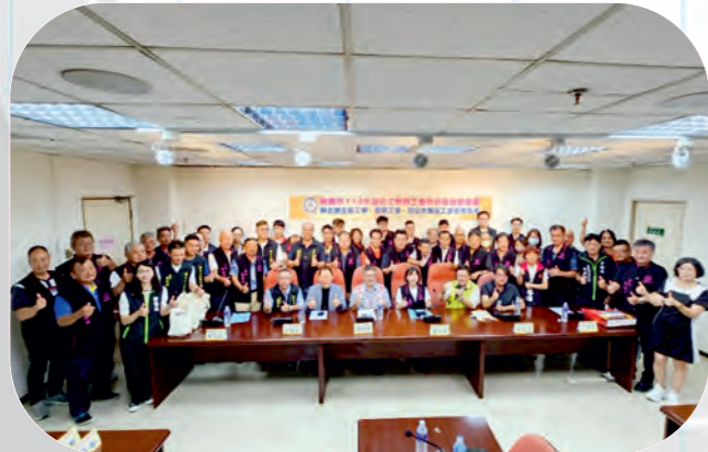
工會幹部實務研習會