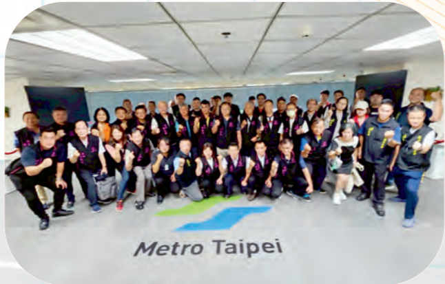
工會幹部實務研習會